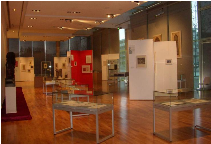
Salle d'exposition des Archives de Strasbourg